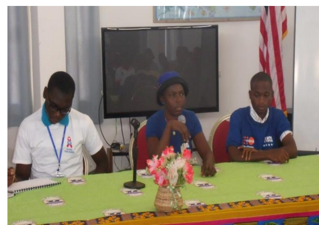
Photo4: Conférence les grossesses précoces en milieu scolaire à Bouaké