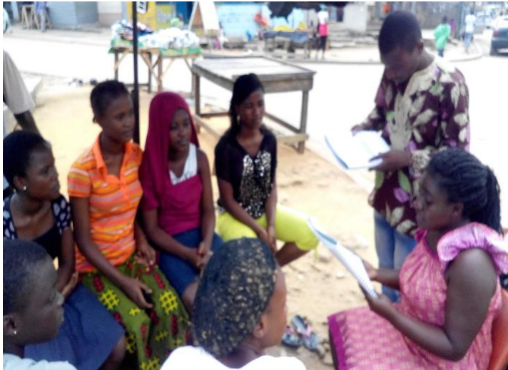
Photo1: Causerie éducative dans le cadre du projet CARA Adjamé

Photos illustrant les activités de l'ONG MESSI durant l'année 2017