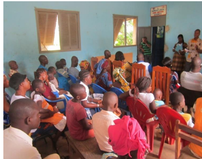
Photo2 : Remise de kits scolaire aux OEV dans le cadre du projet SEV CI Gagnoa