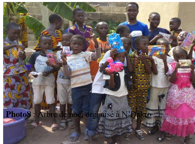
Photo8 : Arbre de Noël organisé à N'Dakro