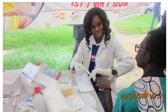
Photo6 : Séance de dépistage volontaire du VIH