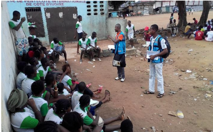
Photo5 : Causerie de groupe dans le cadre du projet CARA