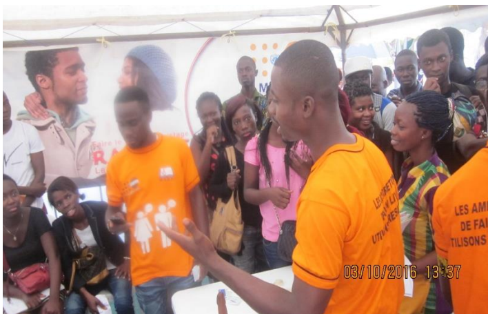
Photo3 : Animation sur les comportements à moindre risque dans le cadre des Journées d'Orientation du Bachelier