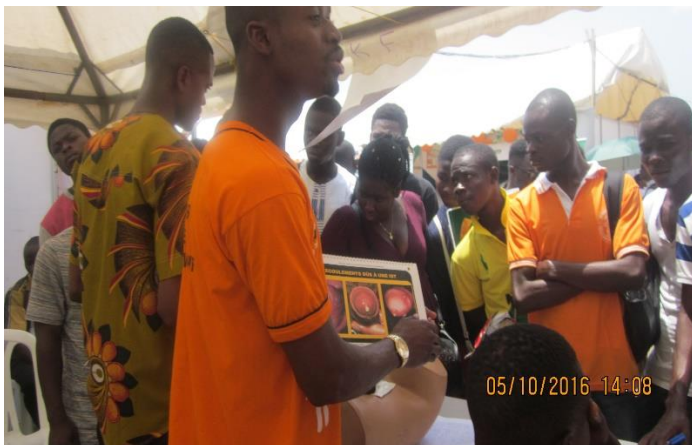
Photo7 : Sensibilisation sur les IST à l'aide de la boîte à image